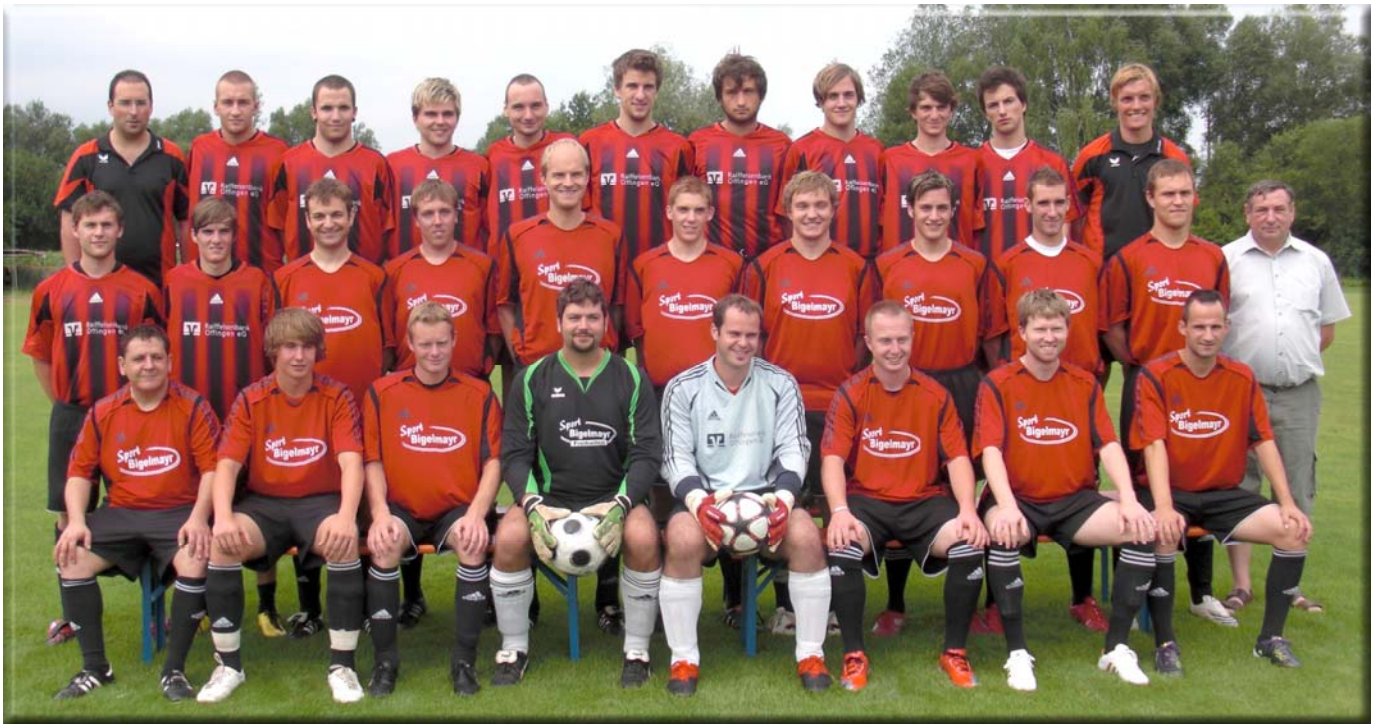
Der Spielerkader der Saison 2010 / 2011

Auch künftig freut sich der TSV Offingen und seine Mitarbeiter auf neue Aufgaben und Herausforderungen. Das Vereinsheim mit Gaststätte, großer überdachter Zuschauertribüne und ein gepflegter Rasenplatz stehen weiterhin allen Besuchern und Gästeteams offen.