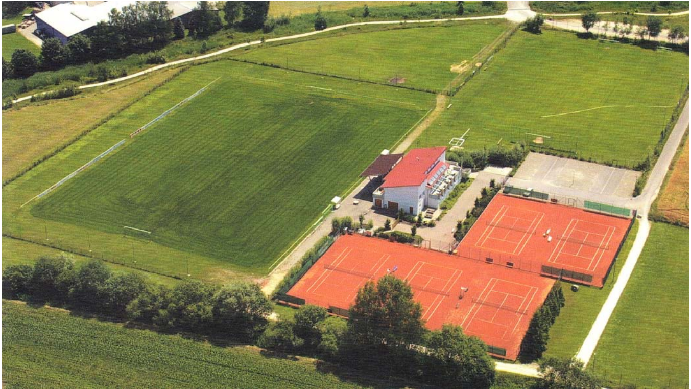
Das komplette Sportgelände des TSV Offingen

Besonders deutlich wird die Notwendigkeit der vergrößerten und modernen Sportstätten auch bei Betrachtung der aktuellen Lage. Im laufenden Spieljahr 2010/2011 nämlich nehmen für den TSV Offingen insgesamt elf Mannschaften am aktiven Punktspielbetrieb teil. Neun Mannschaften davon im Juniorenbereich, in dem teilweise auch Spielgemeinschaften mit den Nachbarclubs aus Rettenbach, Gundremmingen und Mönstetten gegründet wurden, um die Altersklassen von den F1- bis hin zu den A-Junioren durchgehend abdecken zu können.