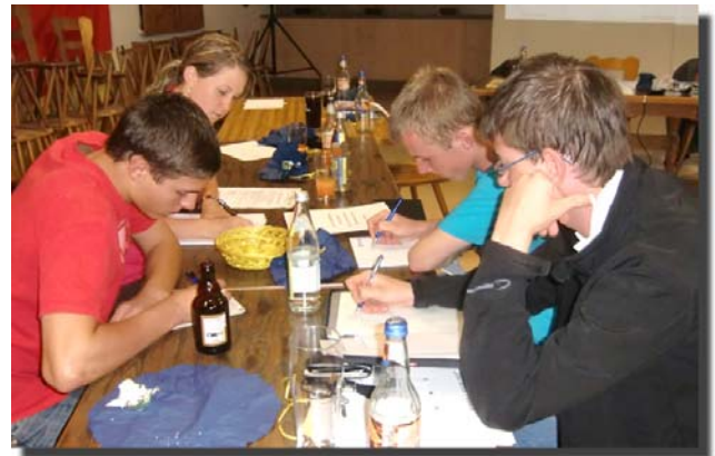
Beim Regeltest rauchten die Köpfe der Teilnehmer.

Nach der Besprechung des am Anfang absolvierten Regeltests konnten sich die Besten einen der zahlreichen Sachgewinne aussuchen.